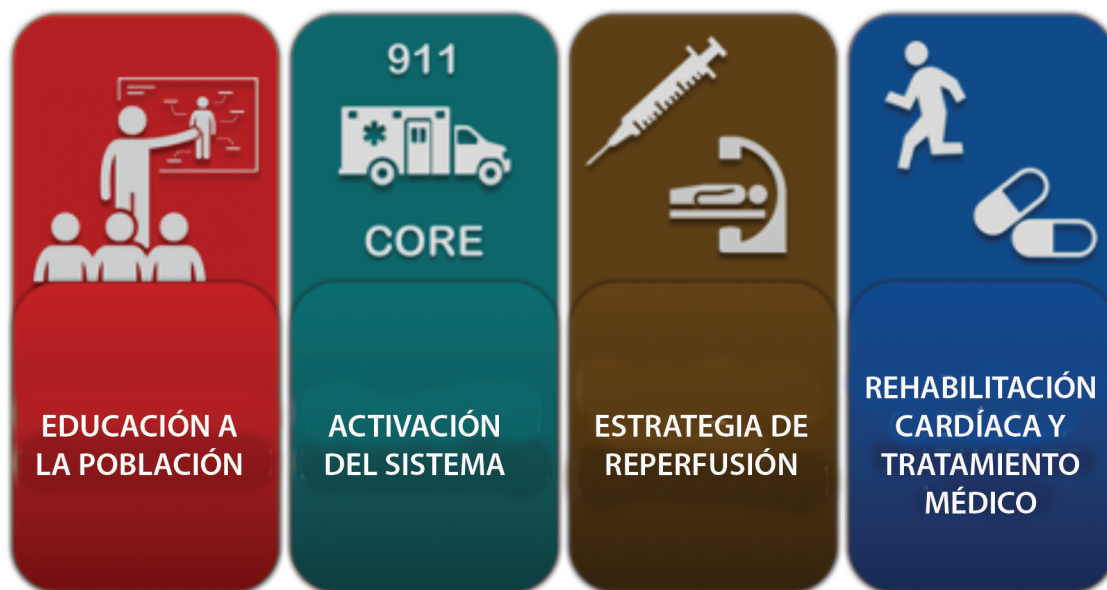
Figura 1. Estrategia de abordaje del paciente con IAMCEST bajo la propuesta de Código Infarto.

Para llegar a tener una oportunidad de diagnóstico temprano, los programas han utilizado la educación como